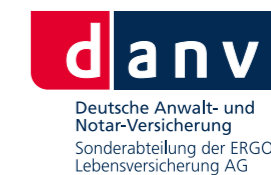
Das moderne Logo der neuen DANV – ab 2010!